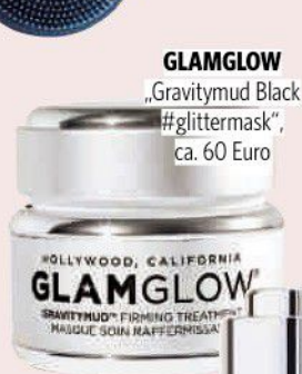
GLAMGLOW „Gravitymud Black #glittermask“, ca. 60 Euro

Wirkstoffe mit der Hand einmassieren? Super! Stattdessen eine elektrische Gesichtsbürste benutzen? Noch besser! Mit Tausenden Vibrationen pro Minute reinigt sie die Haut bis in die Tiefe, regt die Durchblutung an und arbeitet Cremes viel gezielter ein.