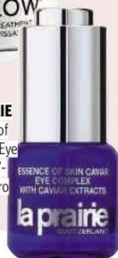
LA PRAIRIE „Essence of Skin Caviar Eye Complex“, ca. 134 Euro