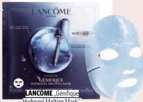
LANCÔME „Génifique Hydrogel Melting Mask“, ca. 13 Euro