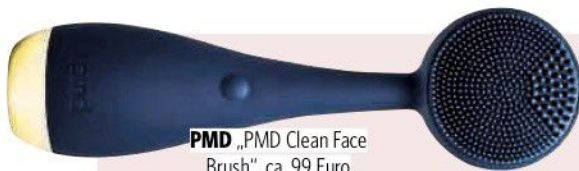
PMD „PMD Clean Face Brush“, ca. 99 Euro

Wir heben ab! Und zwar zu Hollywood-erprobten Treatments und Cremes mit edlen Inhaltsstoffen wie Kaviar – darauf schwört auch Angelina Jolie!