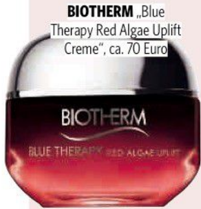
BIOThERM „Blue Therapy Red Algae Uplift Creme“, ca. 70 Euro

Der perfekte Feuchtigkeits-Booster für zwischendurch: Maske auflegen, Wirkstoffe einziehen lassen und das neue, jugendliche Aussehen im Spiegelbild bewundern. Übrigens bekennen sich auch Stars wie Schauspielerinnen Lily Collins zu den Masken.